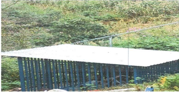
Foto1: Sustitución de bomba de agua.