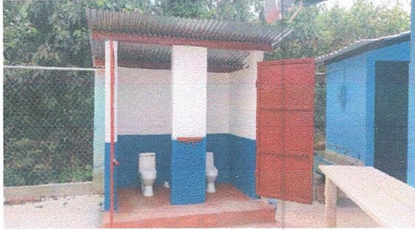
Foto1: Sustrucción de sanitarios y accesorios.