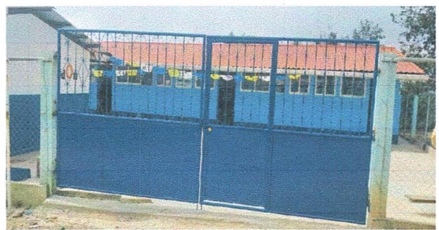
Foto 2: Sustitución de portón de metal con chapa de 5 mts. De ancho por 2.30 mts. De alto